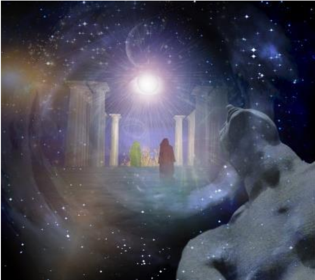
Joonis 1: Astraali Dimensioonid

Autor Wes Penre, Neljapäev, 15. September 2016